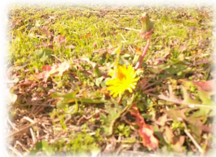
地面を這うように タンポポが咲いています。

2023年は暮れようとしています。そして2024年は始まります。来年は「辰年」です。どの子も龍のごとく天に向かって成長することを願っています。それでは、良いお年を迎えてください。